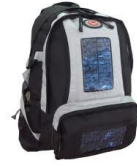
Mochilas de equipaje de mano

Exceso de equipaje es el equipaje que traspasa del volumen del equipaje normal y en la mayoría de los casos tiene que ser avisado a las compañías aéreas. Éstos incluyen por ejemplo: