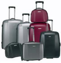
Maletas en diferentes tamaños

El equipaje normal es el equipaje que Uds. dan en el aeropuerto al facturas y que normalmente es gratuito hasta un peso total de 20 kg por persona, por ejemplo: