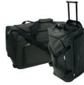
Bolsas de viaje